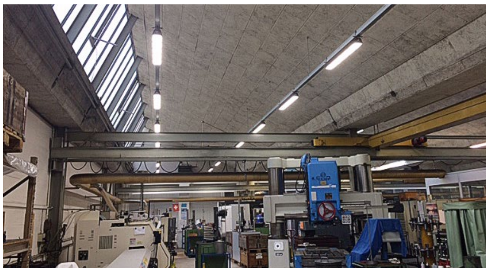
Lampes à LED ELBRO en utilisation industrielle, projet 1, après