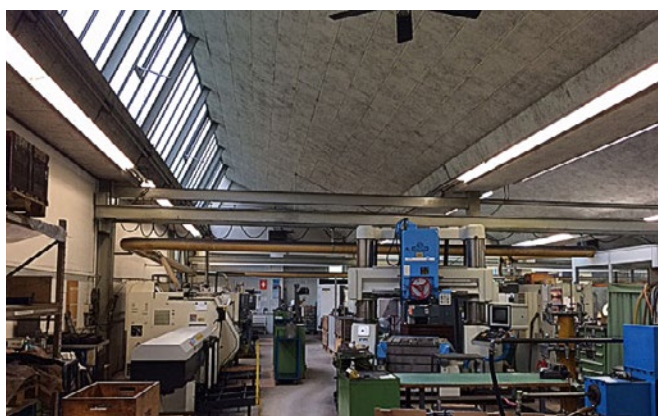
Lampes à LED ELBRO en utilisation industrielle, projet 1, avant

Deux entreprises suisses de renom des secteurs du traitement des métaux et de la mécanique de précision misent désormais, dans le domaine exigeant de la fabrication, sur des luminaires linéaires à LED spécialement modifiés.